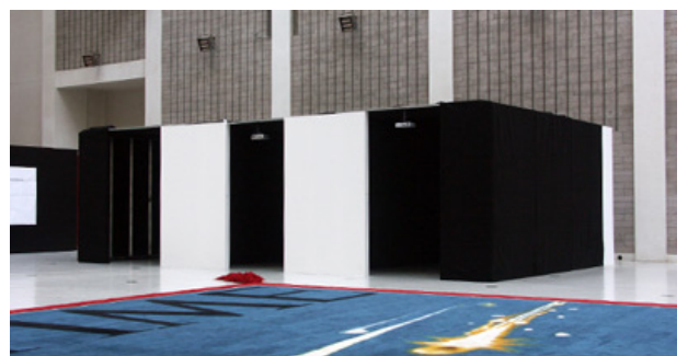
Installation view National Gallery in Prague