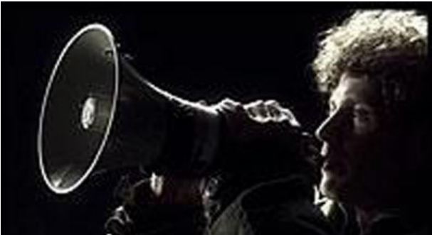
Clemens Von Wedemeyer Occupation, 2002, 35mm film, 9min.

The exhibition of videos “reality blurred” presents videos shown in standalone projection boxes in the main hall of the National gallery in Prague. Videos of Adel Abdessemed, the Blue noses group, Clemens von Wedemeyer emerge and react on specific social and cultural contexts. Creating a layer of glamorous fiction, they have in similar an interrogative relation to (political or social) reality.