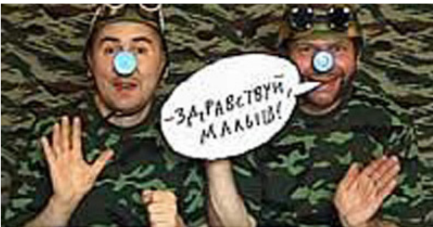
The Blue Noses Group, New Russian Sharades, 2005 video